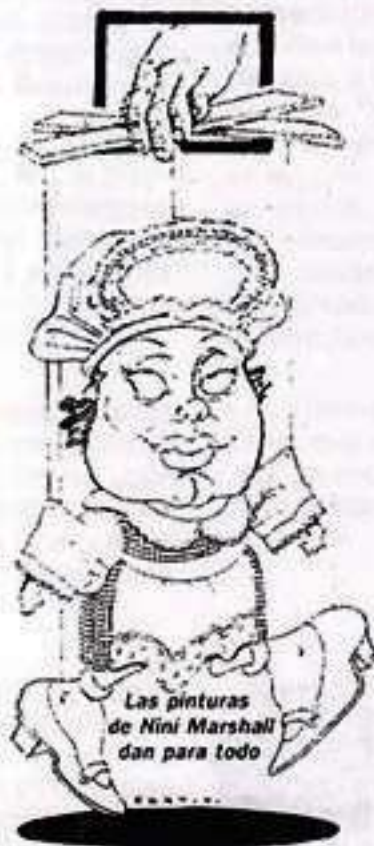
Las pinturas de Nini Marshall dan para todo